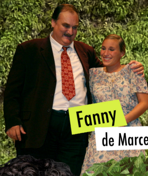
Fanny de Marcel PAGNOL