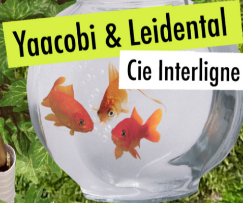
Yaacobi & Leidental Cie Interligne