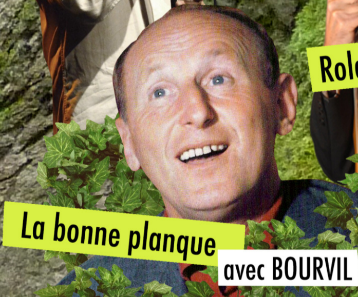
La bonne planque avec BOURVIL